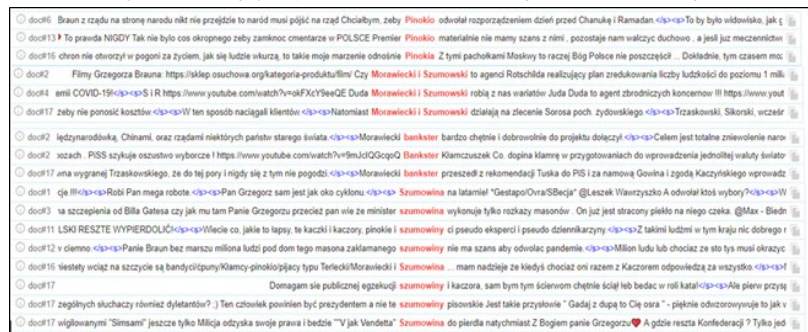
Rysunek 1. Negatywne przedstawienie Łukasza Szumowskiego i Mateusza Morawieckiego.

Z kolei ówczesny premier Morawiecki ukazany był jako kłamca i polityk zatajający przed Polakami prawdę. Polityka opisywano jako kłamcę i „Pinokia” (I, II, III; rysunek nr 1), co współgra z jego przedstawieniem w nieprzychylnych mu mediach (Bendyk, 2020). Analogicznie jak w przypadku ministra Szumowskiego, premierowi Morawieckiemu zarzuczano wykonywanie poleceń wpływowych organizacji zagranicznych (IV i VI; rysunek nr 1). Przedstawiano go również jako reprezentanta interesów banków, wykorzystując do tego strategię nazywania – „bankster” (VII, VIII, IX; rysunek nr 1). Jest to hybryda wyrazów „bankier” i „gangster”, służąca do opisu praktyk spekulacyjnych na rynku finansowym (Łaziński, 2016, s. 88). Odwołanie się do tematyki przestępczej za pomocą dyskursywnych strategii nazywania, orzekania i intensyfikacji akcentuje nieufność zwolenników Brauna odnośnie do działań polskiego rządu oraz wzmacnia narrację o pandemii, która miała być sztucznie wywołana przez wpływowe grupy celem osiągnięcia przez nie partycularnych korzyści.